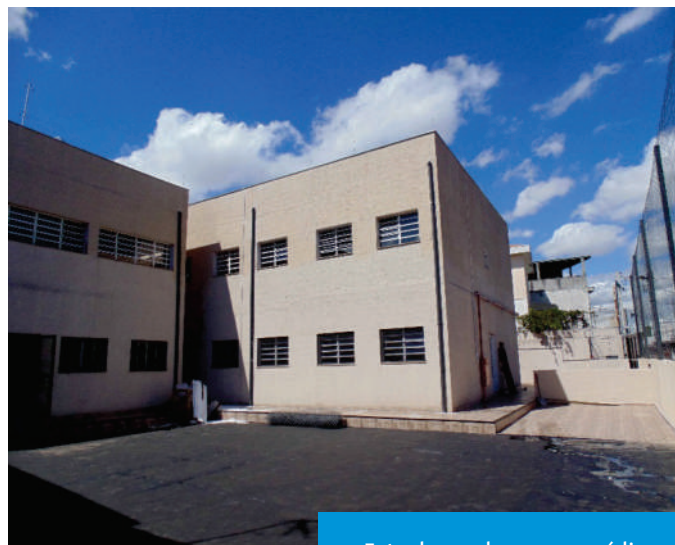
Foto da quadra para o prédio